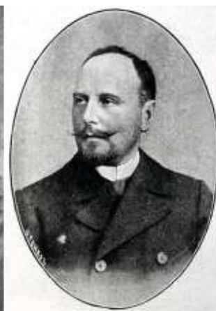
Мученик Алексий ( Нейдгардт ) мирянин 01.09.1863-1918