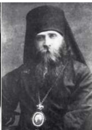
Священномученик Лаврентий ( Князев ) епископ 02.07.1877-1918