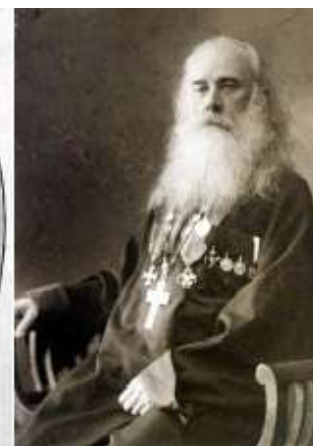
Священномученик Алексий ( Порфирьев ) протоиерей ---1856-1918

Епископ Лаврентий (в миру Евгений Иванович Князев) родился в 1877 году в городе Кашире. Происходил из духовного звания. Был единственным сыном у матери-вдовы. Начальное образование получил в Веневском духовном училище, среднее – в Тульской семинарии. В 1902 году окончил Санкт-Петербургскую Духовную академию со степенью кандидата богословия. 28 января 1902 года пострижен в монашество на Валааме архиепископом Сергием (Страгородским), а 5 февраля рукоположен в иеромонаха.